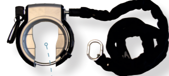
kaderslot/ringslot met insteekketting